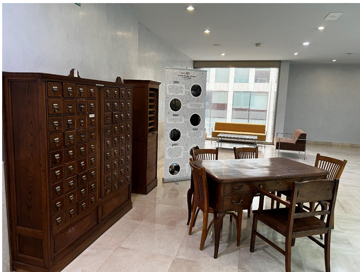
Mobiliario del ILLA, que perteneció originalmente al Centro de Estudios Históricos.