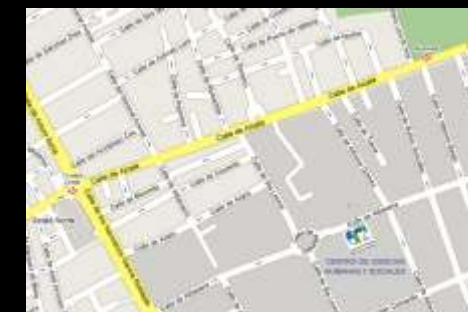
Salón de Actos. Centro de Ciencias Humanas y Sociales, CSIC C/ Albasanz 26-28, 28037 Madrid (España)